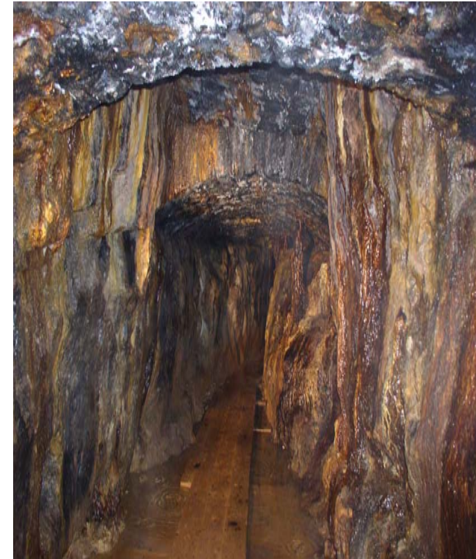
Hauptstollengang auf der 1. Sohle der „Reichen Zeche“

04. bis 06. November 2010 TU Bergakademie Freiberg